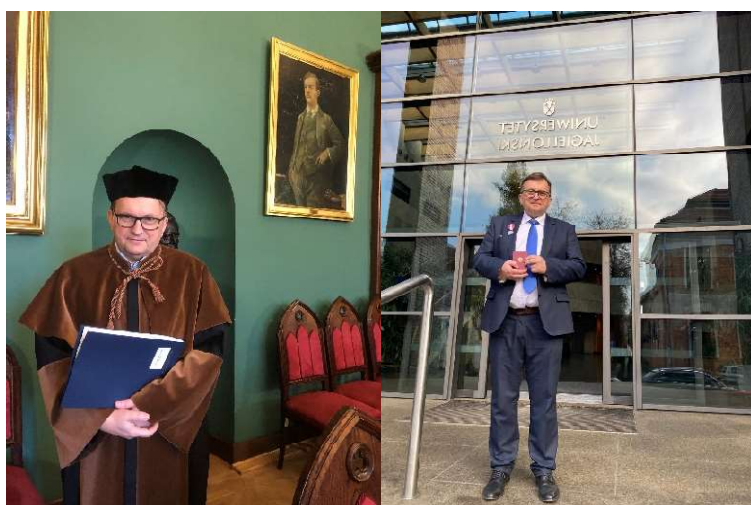
Podczas zatrudnienia w UJ

Zostałem wyróżniony za działalność badawczą, organizacyjną i dydaktyczną w UJ za lata 2016-2020. Za osiągnięcia naukowe otrzymałem m.in. liczne Nagrody Rektora Uniwersytetu Jagiellońskiego, a także odznaczenie państwowe – medal srebrny za długoletnią służbę nadany przez Prezydenta RP na wniosek władz UJ. Obecnie jestem profesorem uczelni Uniwersytetu Zielonogórskiego.